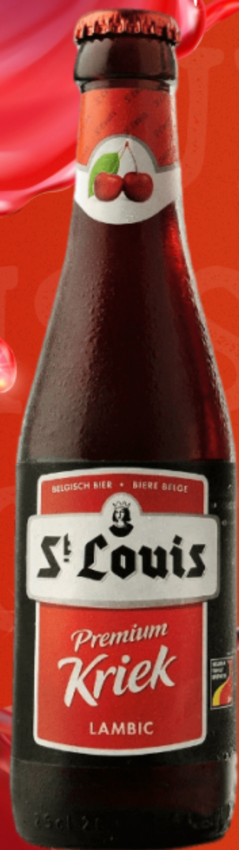
ST. LOUIS KRIEK