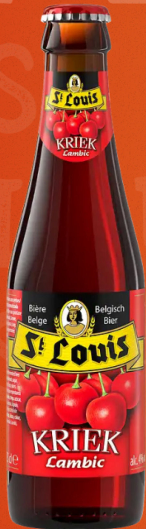
ST. LOUIS KRIEK LAMBIC