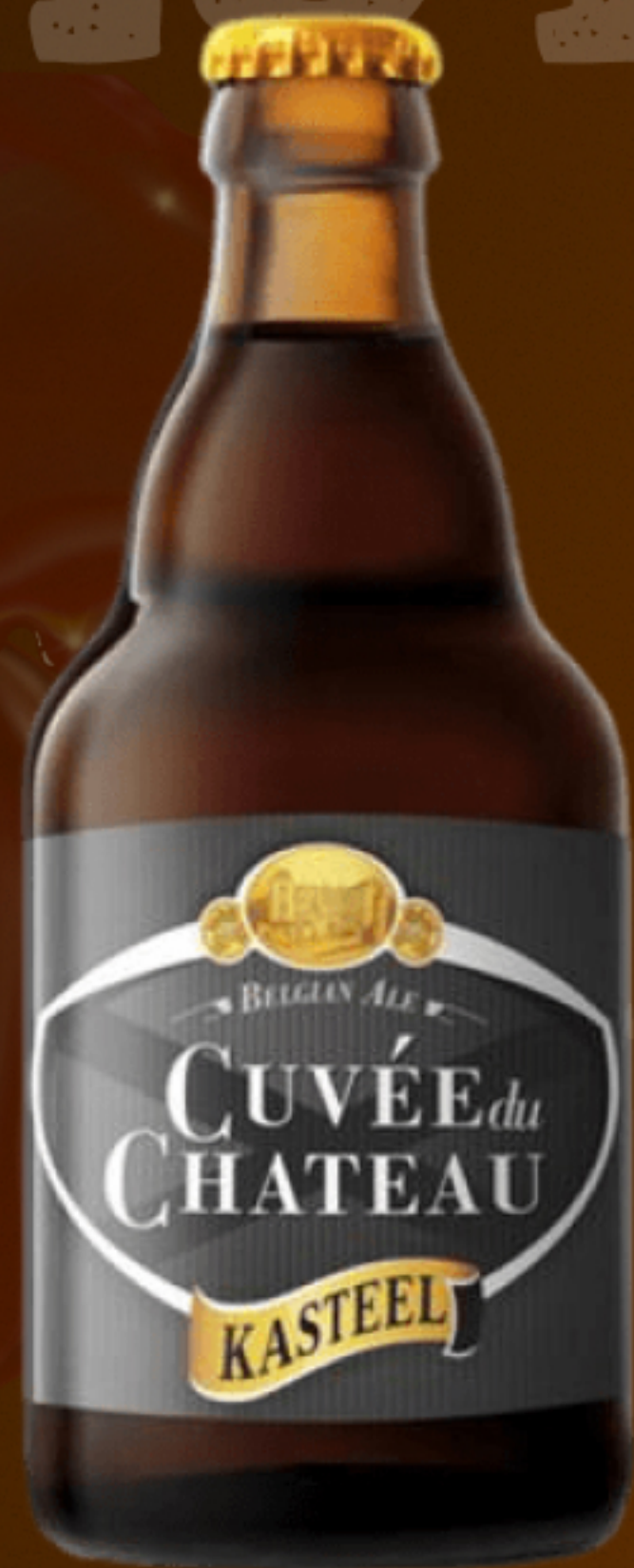
KASTEEL CUVÉE DU CHATEAU