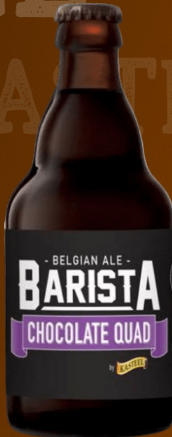
KASTEEL BARISTA CHOCOLATE QUAD