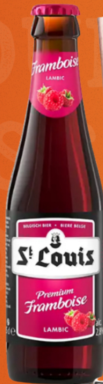
ST. LOUIS FRAMBOISE